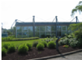
L'Agropole à Estillac

Dans le cadre du Contrat de Pays 2004-2006, le Syndicat Mixte du Pays de l'Agenais s'est lancé dans l'élaboration de son Schéma de Développement Economique. A l'issue de la consultation, la mission a été confiée à un cabinet extérieur : le bureau d'études CODE basé à Bordeaux.