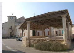
Halle Pozzo à Laroque-Timbaut

Ce numéro de la Lettre d'information du Pays intervient à l'issue d'une période de renouvellement des organes délibérants des communes, des communautés de communes, de la communauté d'agglomération et du conseil général. Le Syndicat Mixte du Pays de l'Agenais a réuni à la fin juin ses membres, nouvellement désignés par leurs collectivités respectives. Son Bureau a été renouvelé et le Comité syndical m'a fait l'honneur de me reconduire à sa présidence.