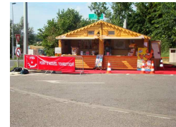
Le Chalet installé à la sortie du péage autoroutier de l'A62