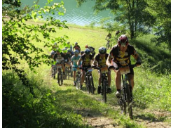
Randonnée VTT à Engayrac

« CONCEVOIR ENSEMBLE DES PROJETS D'AVENIR À L'ÉCHELLE DU BASSIN DE VIE »