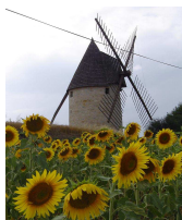
Le moulin de Cuq