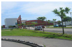
La zone de Trenque à Agen (site de l'ENAP)

Le schéma de développement économique est destiné à coordonner les politiques économiques à l'échelle du Pays, et ce, en concertation entre les collectivités. L'objectif est d'élaborer une démarche territoriale, collective et cohérente en matière de développement économique, afin d'éviter la multiplication de démarches isolées. Le schéma doit également permettre en externe de positionner l'offre économique du territoire de manière lisible par rapport aux agglomérations et pays environnants.